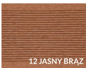
12 JASNY BRĄZ