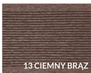
13 CIEMNY BRĄZ